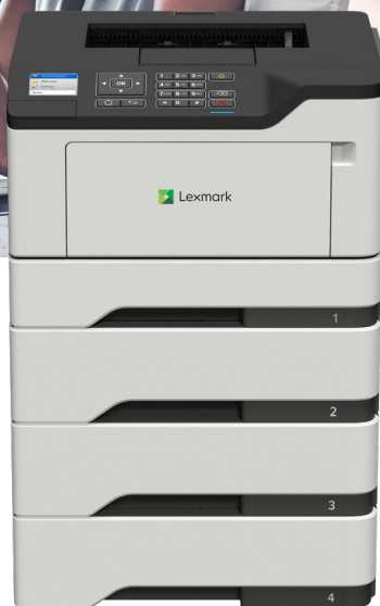
B2546dw z dodatnimi pladnji